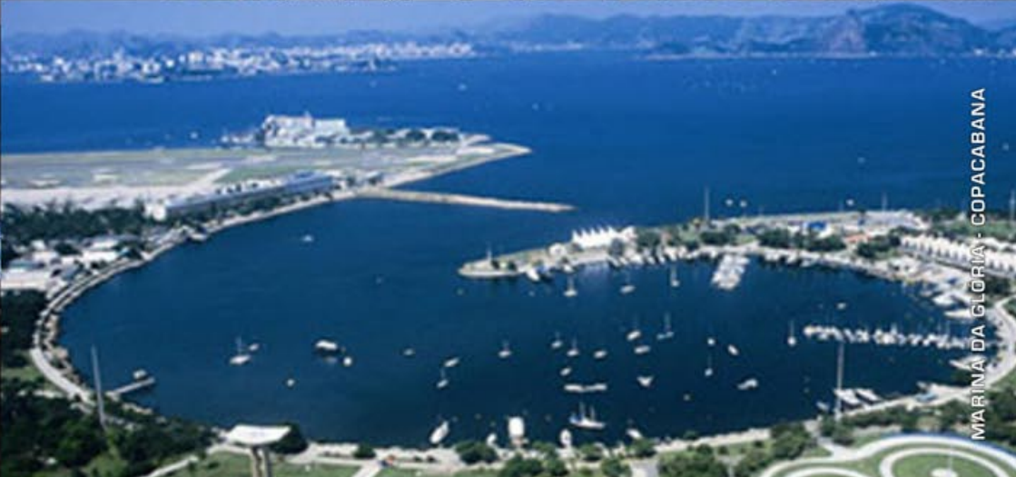
MARINA DA GLORIA - COPACABANA