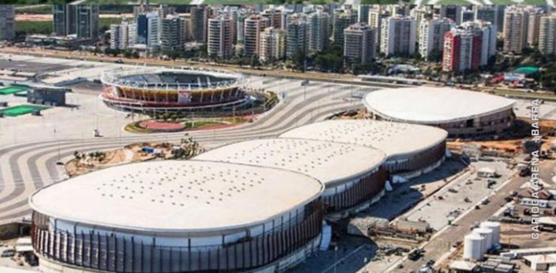
CARIOCA ARENA - BARRA