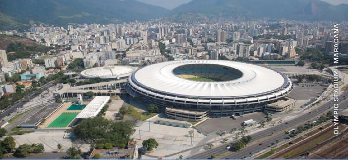
OLYMPIC STADIUM - MARACANA